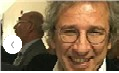
Can Dündar ve Erdem Gül'den CHP kurultayına mektup