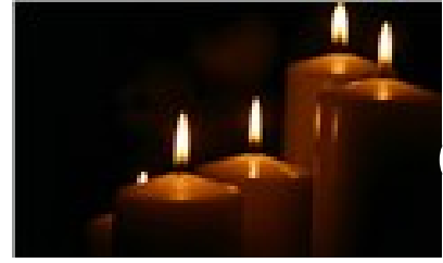
İstanbul'un 12 ilçesine 2 günlük elektrik kesintisi